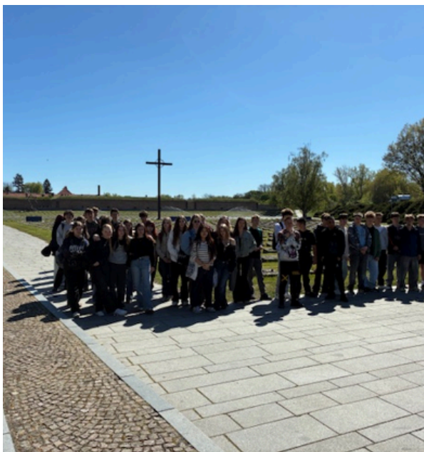
Terezín - 9.ročník