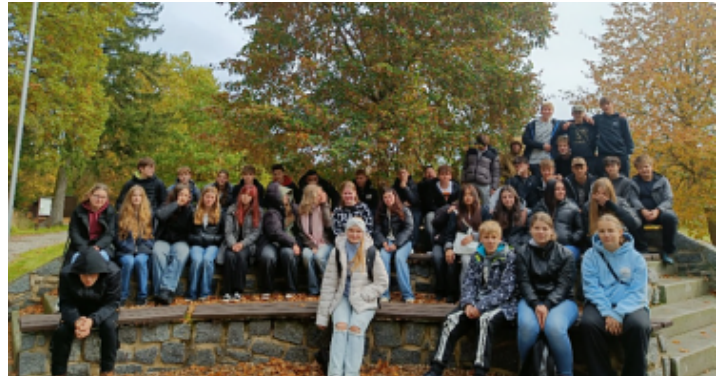
Památník Vojna a Lety