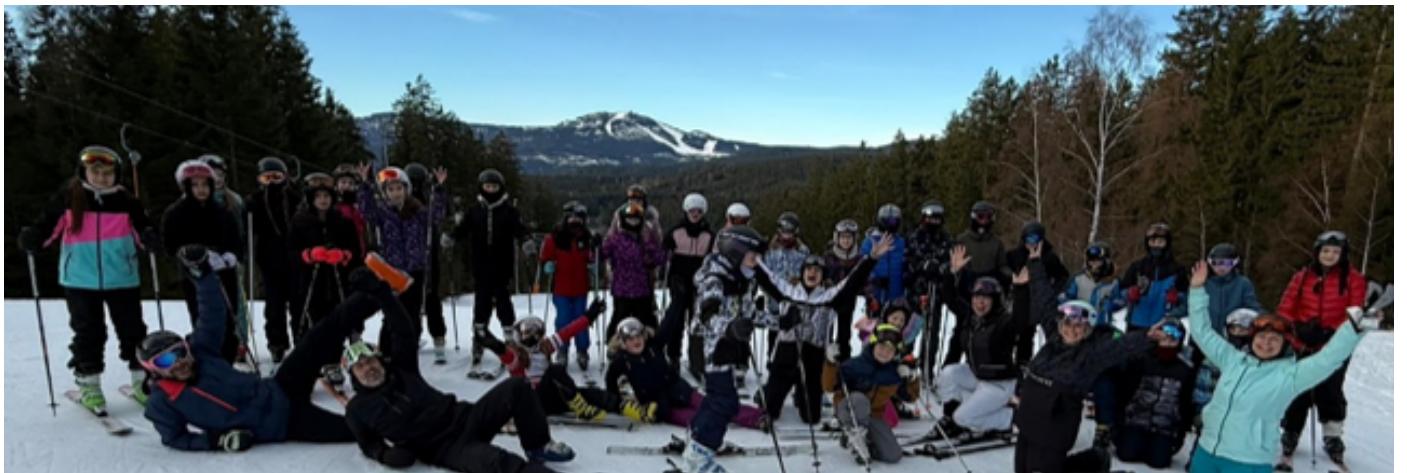
Lýžařský kurz Šumava