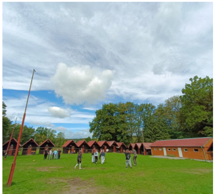
Míreč - 8. ročník