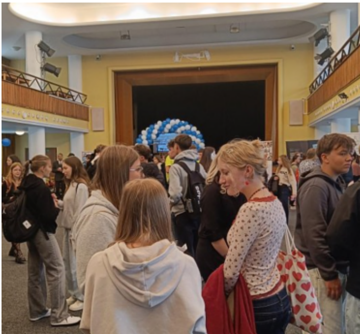
Burza středních škol