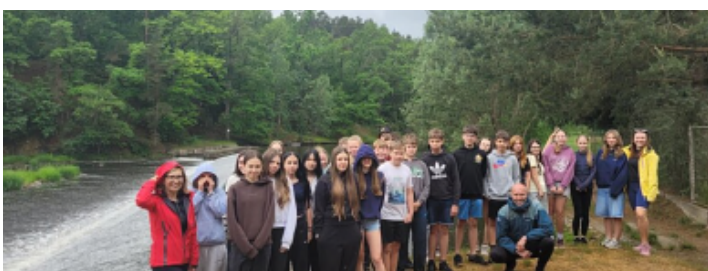
Sportovní kurz - 7. ročník