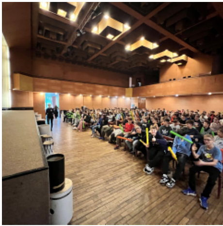
Bubny do škol