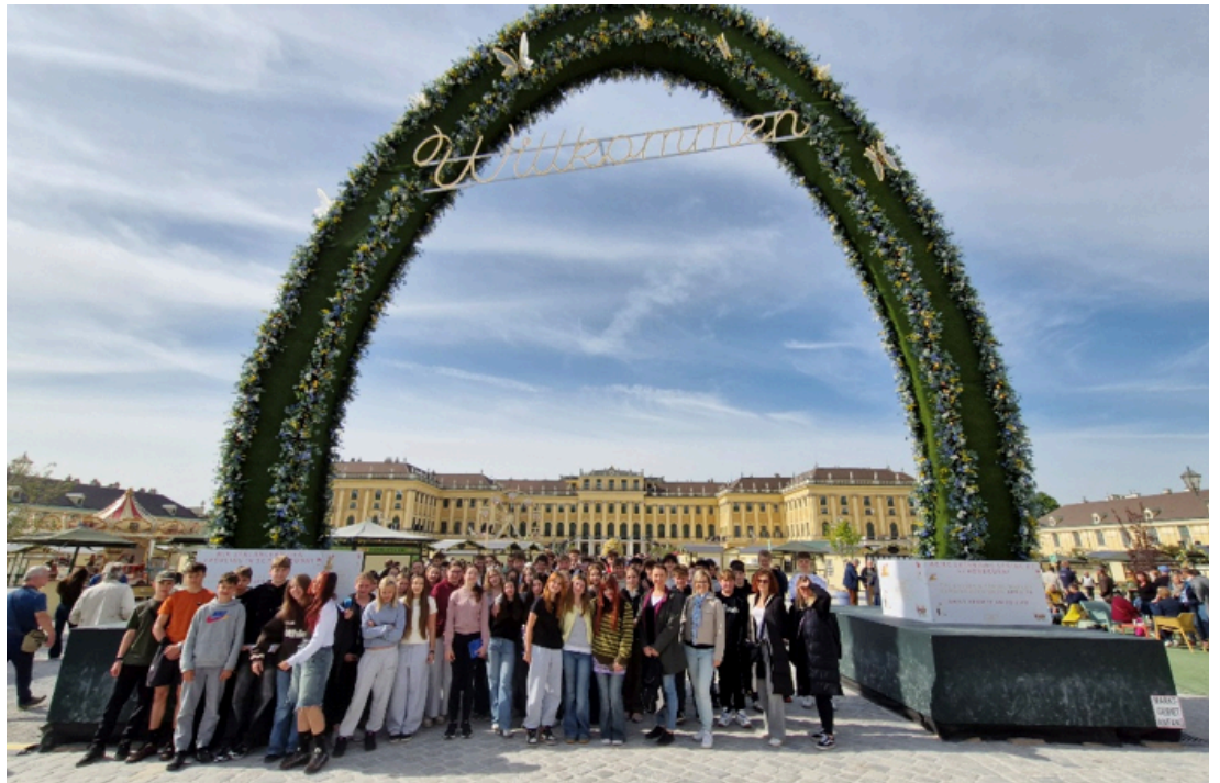
Celodenní zájezd do Vídně