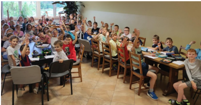
Škola v přírodě - 3. ročník