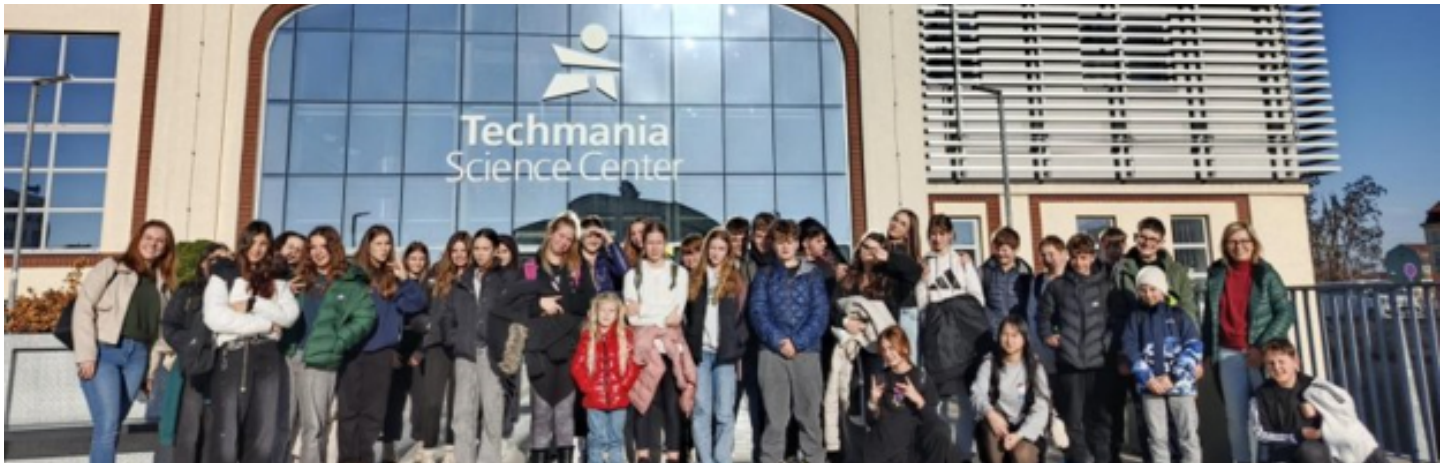
Techmánie - 7. ročník